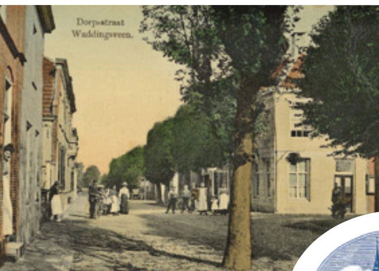
Het oude dorp

UITGAVE VAN HET HISTORISCH GENOOTSCHAP WADDINXVEEN