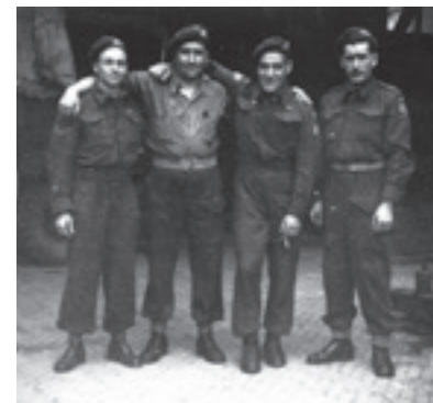
Canadese militairen op de Zuidkade

Hoewel er op 8 mei nog geen Canadese troepen in het dorp kwamen, is er later toch wel een kleine eenheid geweest die bij de houthandel Alblas onderdak genoot. Van hun aanwezigheid zijn wel foto's beschikbaar. 10 De reden van hun komst was de melding dat Duitse soldaten nog de wacht hielden bij een opslagplaats in Waddinxveen. De 3e Infanteriebrigade kreeg op 14 mei van de divisie opdracht de Duitse wacht te vervangen door Canadese militairen. Dit verklaart waarschijnlijk de foto's met een kleine groep Canadese militairen