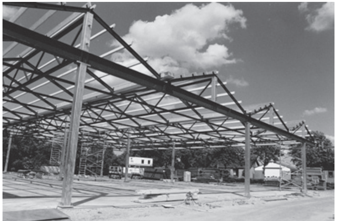
Houtex, nieuwe locatie.