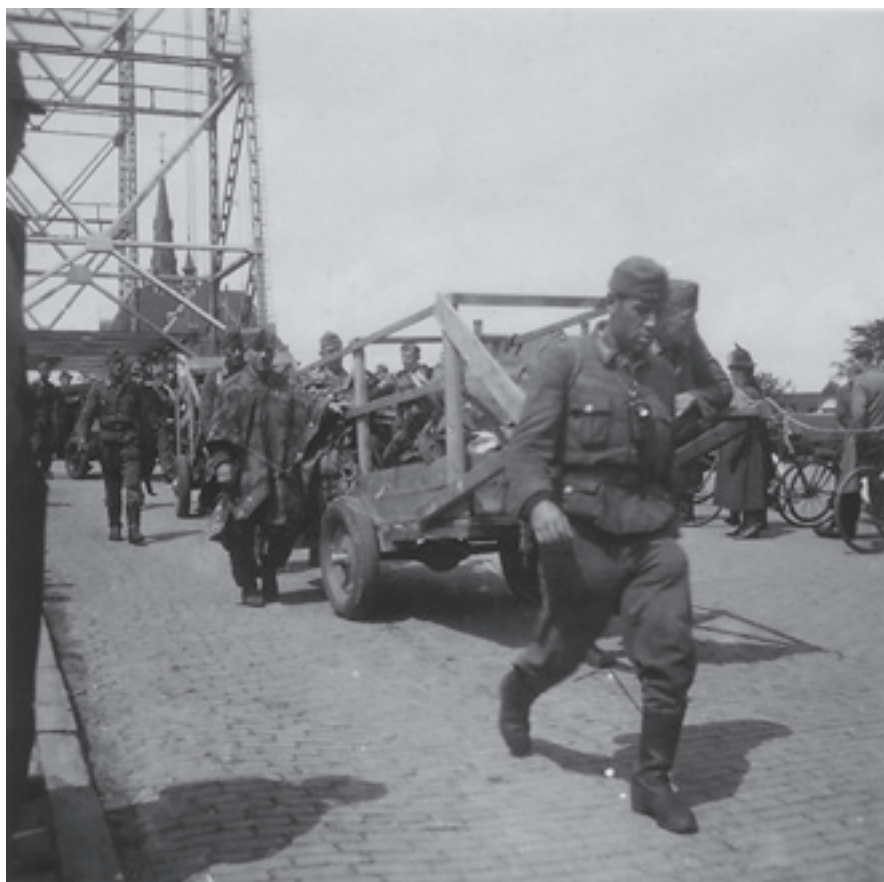
Duitse krijgsgevangenen op weg naar Den Helder gaan over de hefbrug van Boskoop.

bij het Alblascomplex aan de Zuidkade. De nog aanwezige Duitse militairen in Waddinxveen zijn toen, samen met die uit Alphen aan den Rijn en Gouda, afgevoerd naar het door R22R beheerde krijgsgevangenkamp.