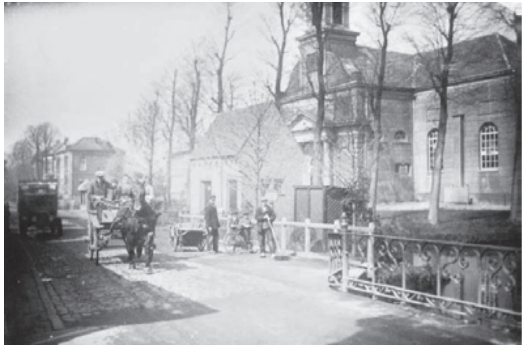
Het begin van de Kerkweg met de 'Grote Kerk' en net zichtbaar de brugleuning van de Smidsbrug.