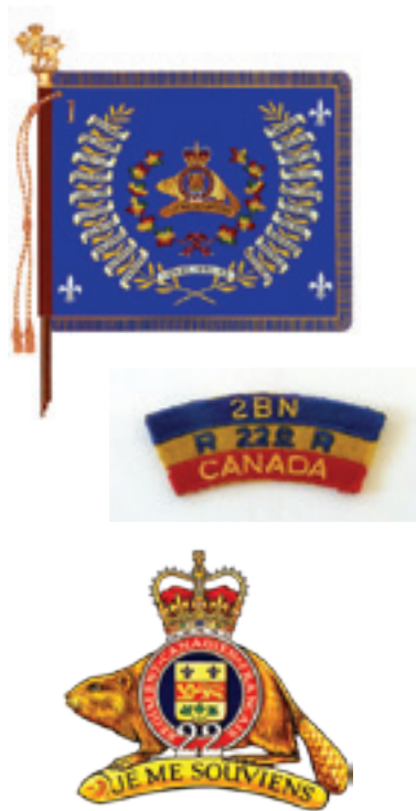
Van boven naar beneden:

Het vaandel en twee emblemen van het Canadese 22ste Koninklijke Regiment het schouderembleem het baretembleem