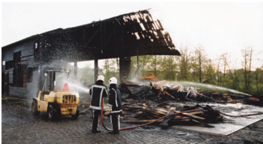
Brand op 21 april 1999.