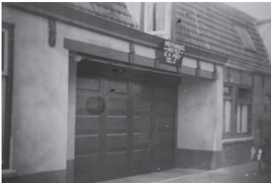
De loods aan de Zuidkade waar Houtex begonnen is.

liep een brede sloot die ooit diende als vaarweg om vanuit Rotterdam via de Rotte, Moerkapelle, de ringvaart van de Achterofsche polder en het sluisje aan de Nesse naar de Gouwe te komen. Via die sluiproute konden de hoge tolgelden worden vermeden die in Gouda werden geheven als men vanaf de Hollandse IJssel naar de Gouwe wilde varen. Aan die sloot hadden veel bewoners een stoep om water te scheppen en groenten of de was te spoelen.