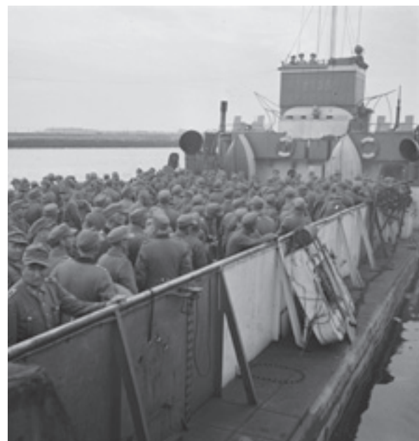
In Den Helder worden de ontwapende Duitse soldaten in LCT boten ingescheept met bestemming Harlingen, vanwaar te voet de lange reis naar de "Heimat" wordt afgelegd.

Afgaande op de dagboeken van de Canadese eenheden is het onwaarschijnlijk dat op 8 mei 1945 Canadezen van R22R of van andere eenheden door de bebouwde kom van dorp Waddinxveen zijn getrokken. Deze constatering lijkt te worden bevestigd door het ontbreken van foto's van de in- en doortocht. <