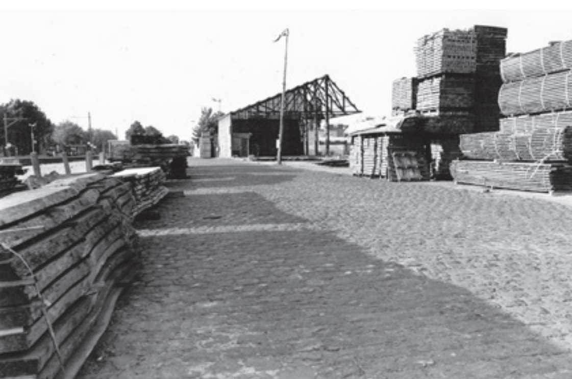
Houtopslag bij het station.

Hoe ervaart Poot het leven in ons dorp? Zijn antwoord is vrij nuchter: "Het is zoals het is. Je kunt de ontwikkeling niet stilzetten, ons dorp is de laatste zestig jaar enorm uitgebreid en daarmee is het voorzieningsniveau ook toegenomen. Dat is de winst. Wel is het jammer dat er zoveel herkenbare plekjes en gebouwen zijn verdwenen. Die gaven ons dorp wel een eigenheid, een karakter en een dorpsgevoel."