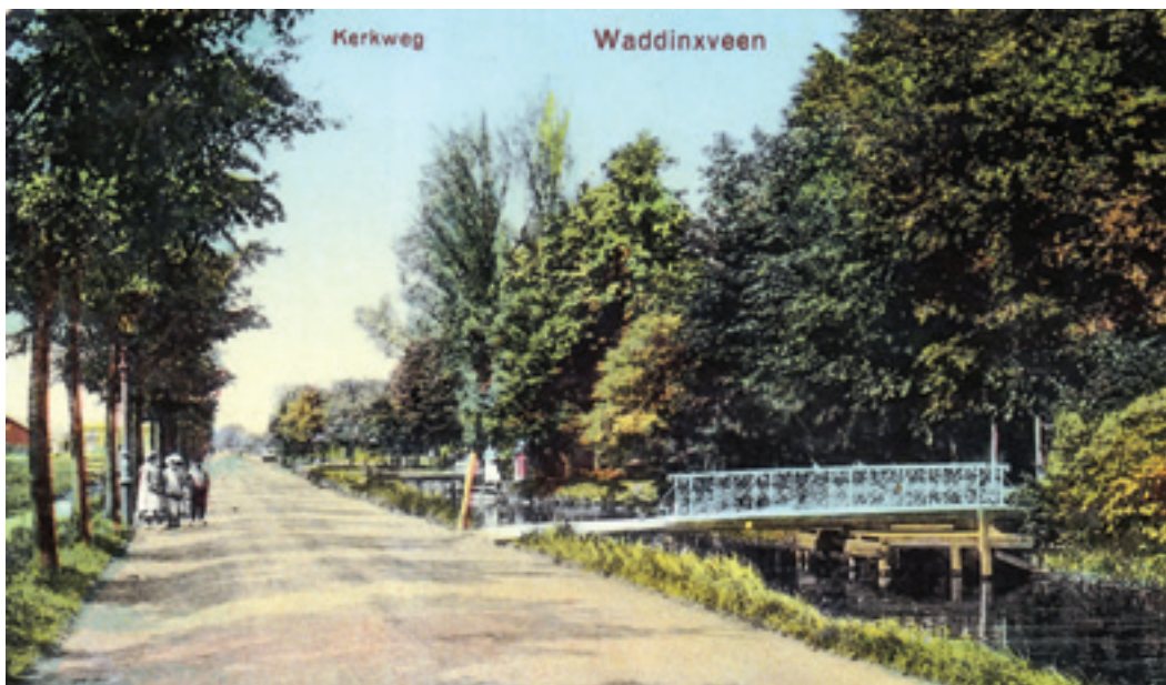
De Kerkweg in westelijke richting tussen de bebouwing bij de brug over de Gouwe en het gebied bij het oude dorp.